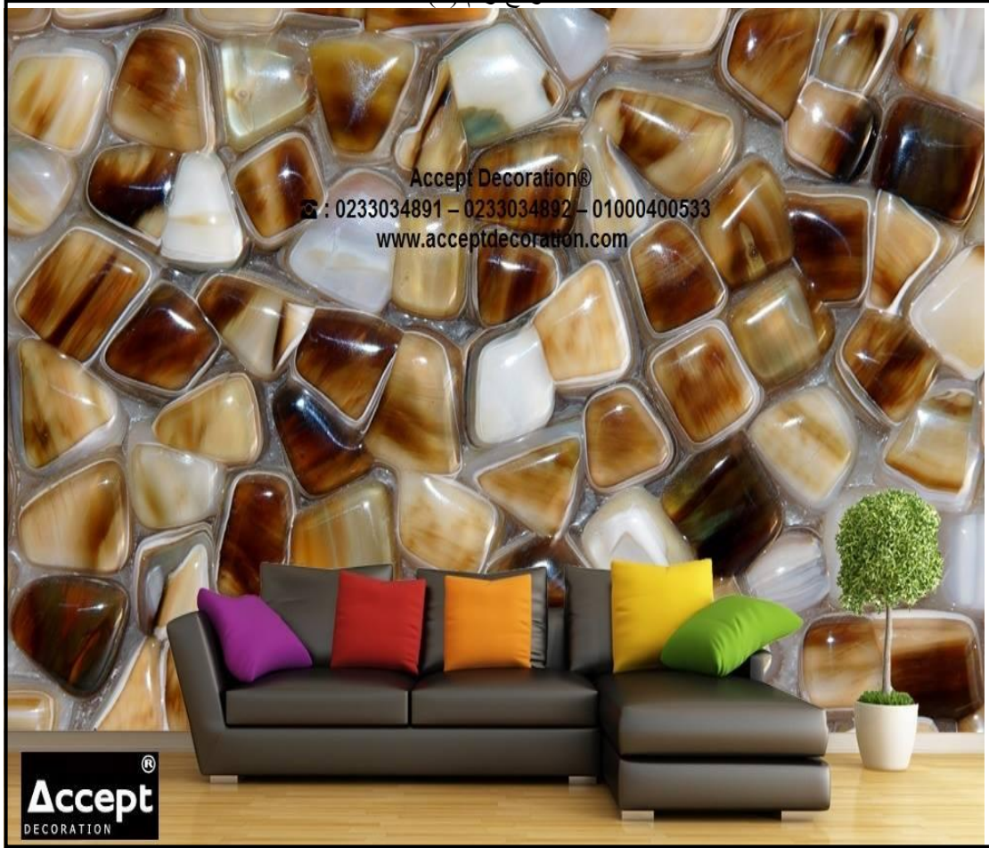
نموذج رقم (6)

نموذج رقم (6):- شكل هذا النموذج نوعا من الحداثة والذي ابتعد عن المألوف من خلال استخدام ورق جدران يمثل الأحجار الكريمة باللون الأبيض والقهوائي المتدرج بين الغامق والفاتح إضافة إلى الخلفية التي وضعت عليها الأحجار وهي باللون الرمادي الذي شكل وحدة متناسقة مع الأريكة ، إضافة إلى استخدام الألوان الحارة ( الأصفر ، البرتقالي ، الأحمر ) ممتثل بألوان الوسائد. نرى في هذا النموذج أن المتلقي ينشد انتباهه إلى ورق الجدران أكثر من تفاصيل الفضاء من أثاث ومكملات أخرى داخل هذا الفضاء أيان عامل الجذب هنا هو ورق الجدران.